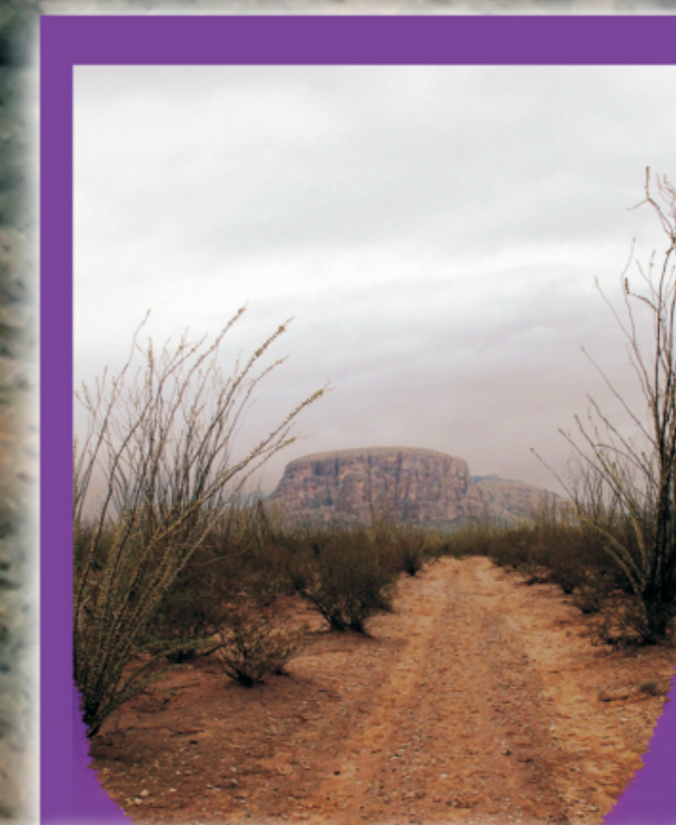
CERRO LA TIENDITA - SIERRA LA GLORIA