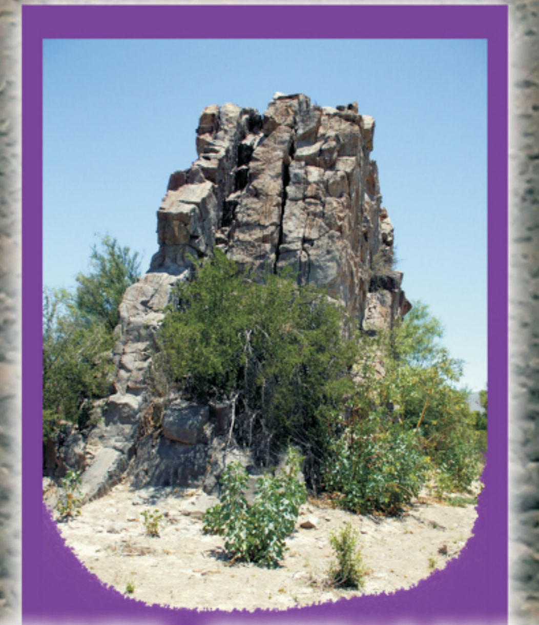
EL CERRITO - CUCHILLO PARADO