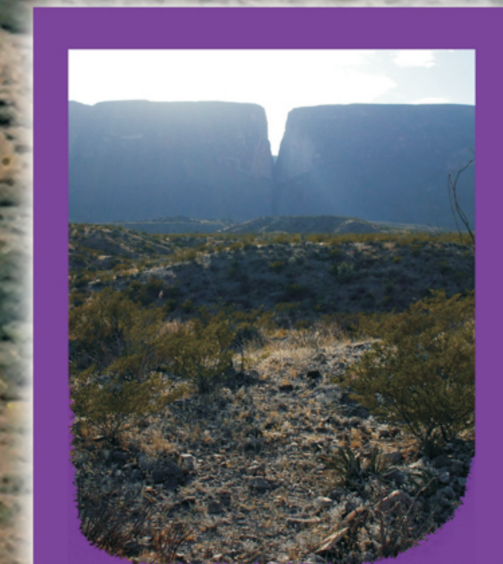
GRIETA EL ABRA - SIERRA PONCE