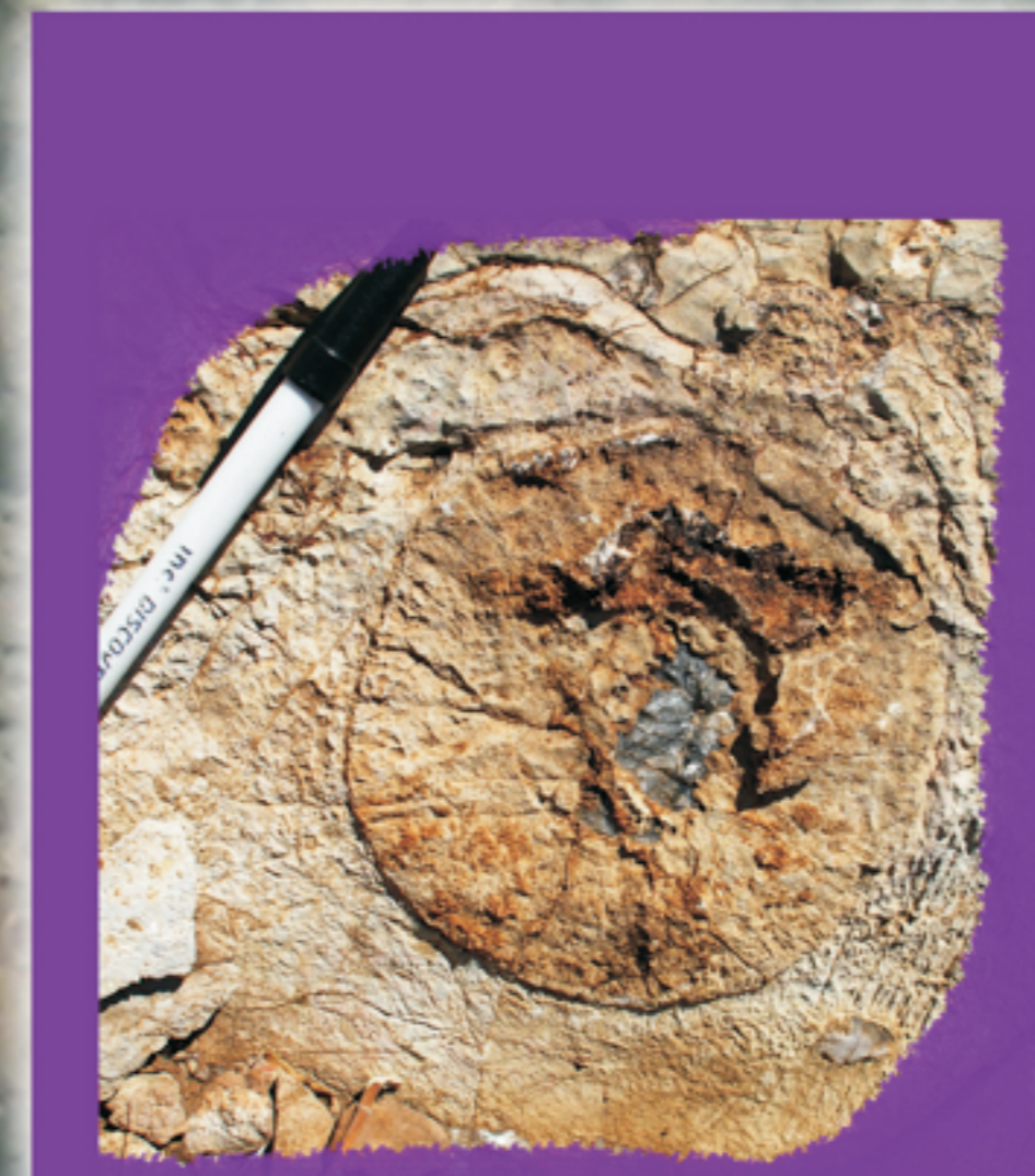
ESPONGIARIOS - PLOMOSAS